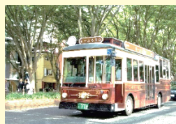
④ 定禅寺通り・るーぷる仙台