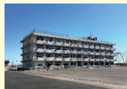
⑤ 震災遺構・荒浜小学校